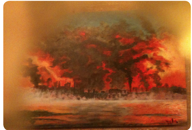
Autora: Pilar Mariscal