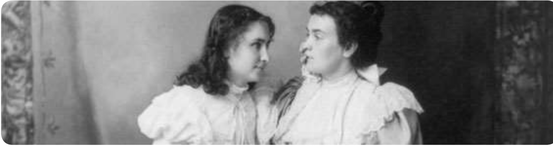
Hellen Keller con su profesora Anne Sullivan